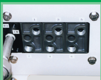
BOX内配管(通常タイプ)